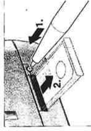
3. Insert the SIM card in the SIM card holder and push it back into the housing.

"START" eingeben und die Maschine startet. Die Bedingung ist jedoch, dass das System ständig mit Druck von den Bodenleitungen beaufschlagt ist.