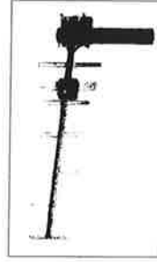
Yagi-Antenne Gain 10 dB Das sind 6 dB mehr als die Standardantenne und entspricht einer Erhöhung der Signalstärke um 3.

Option bei extrem schlechten Empfangsverhältnissen: