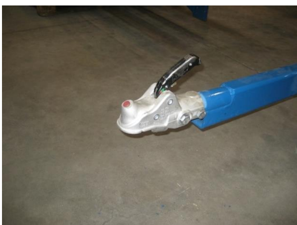
Boule d'attelage de haute qualité pour montage et démontage facile et qui assure un transport et un travail stable.

Équipement: Vérin hydraulique (1 DE) et commande électrique (prise 12V) pour chargement et déchargement. Système d'éclairage et de signalisation routière obligatoire. Roue de remisage