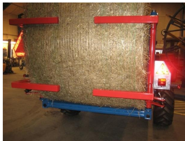
Bras de retenue solides avec vérins à double effet.