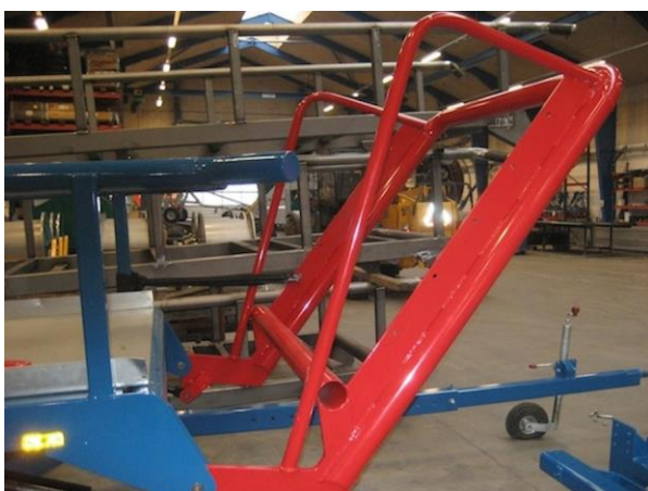
Support de levage robuste, avec la possibilité de monter un tube supplémentaire pour chargement de petites balles.