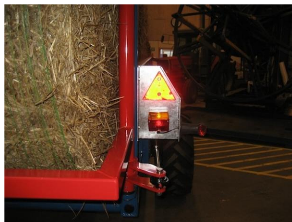
Équipé de système d'éclairage et de marquage obligatoire.